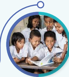
۲۵۸ میلیون کودک و نوجوان به مدرسه دسترسی ندارند خبرگزاری ایسنا- ۴ بهمن ماه ۱۳۹۸

مهسا سلطانی، خبرنگار | آموزش یکی از ارکان و عناصر حقوق بشر، یک خیر عمومی و یک